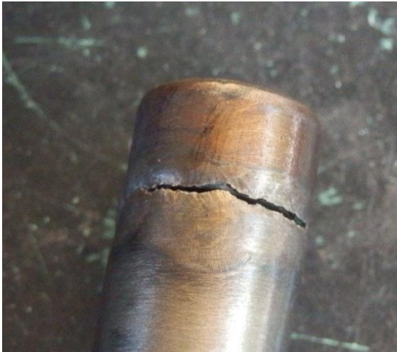
Résultat d'un essai d'éclatement

Le burst test consiste à déterminer la pression d'éclatement d'un élément sous pression. L'élément à tester est donc soumis à une pression croissante jusqu'à atteindre la rupture. L'élément est jugé conforme si la pression atteinte lors de l'essai dépasse la pression prévue. Ce test est appliqué pour qualifier des éléments de tuyauterie ou des réservoirs qui seront soumis à la pression lors de leur utilisation.