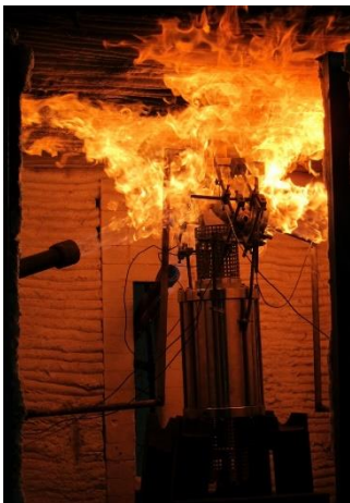
Essai de résistance au feu

L'essai de résistance au feu place un appareil de robinetterie sous pression d'eau dans les conditions d'un incendie. Pour ce faire, le déroulement du test comprend une exposition au feu durant 30 minutes, suivie d'un refroidissement brusque à l'eau et la manipulation de l'élément en fin d'essai. Durant toute la durée de l'essai, les éventuelles fuites externes et au siège sont mesurées et comparées par rapport aux valeurs de référence imposées par